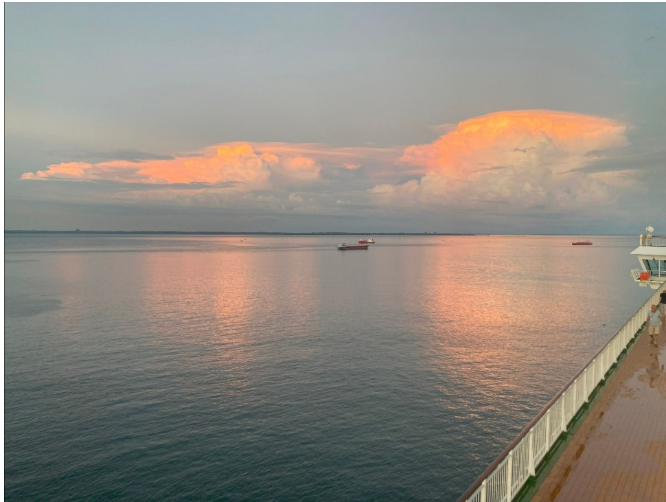
In de wateren van West-Afrika...