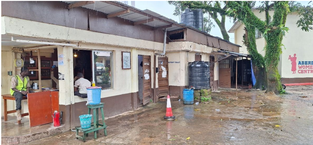
Aberdeen women center laboratorium