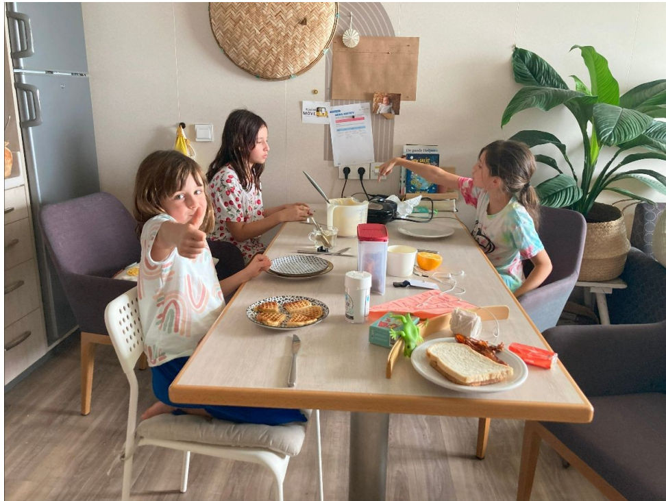
Lekker wafels bakken!

De luchten zijn hier zo prachtig deze afgelopen maand, het is een duidelijke overgang van het regenseizoen naar het droge seizoen. We hebben dan ook flink wat onweer hier en daar, en dat levert vaak een bijzonder schouwspel op. Maar ook dan gaan onze gedachten meer dan eens naar de vele mensen die hier in de sloppenwijken onder een ijzeren afdakje/ huisje leven. Denk even aan strandhokje formaat. Wat leven wij in een bubbel op het schip en in rijkdom.