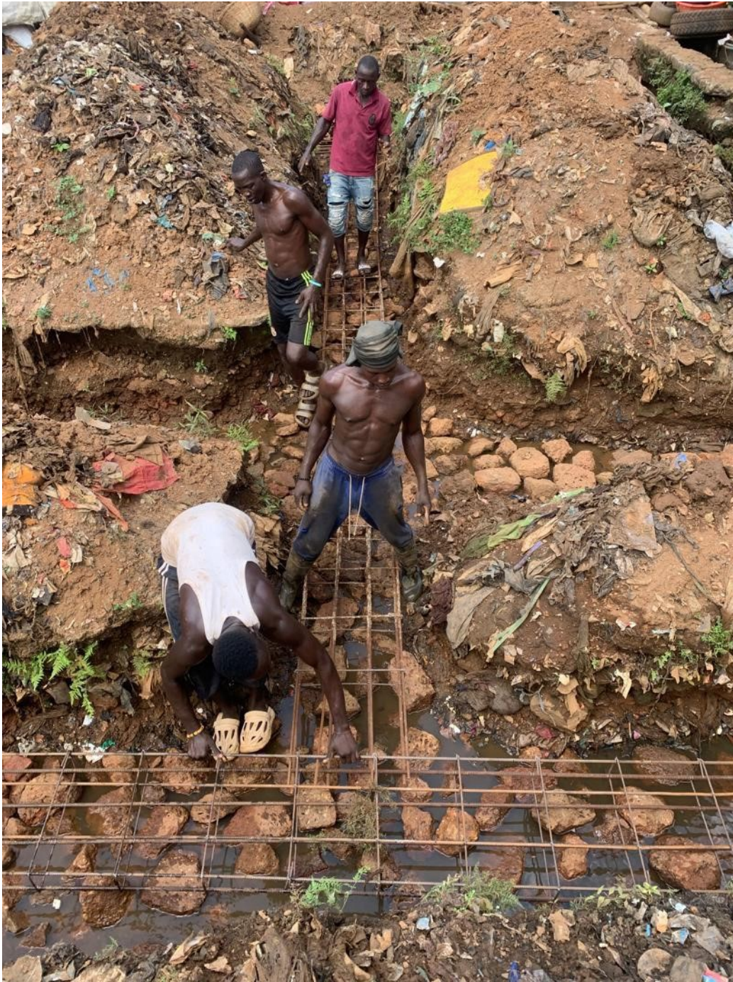
Werken aan de fundering in de sloppenwijk