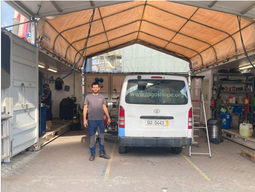
Groot onderhoud in de werkplaats

Misschien is deze missie iets voor u of jij die dit leest? Wij zijn erdoor geraakt en bevelen het van harte aan en mocht je vragen hebben, mail of app ons gerust!