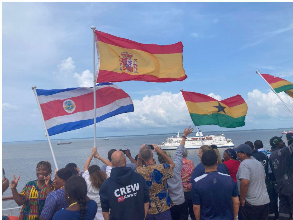
Uitzwaaien van de Logos Hope

Terwijl het schip in de haven ligt, bezoeken teams gemeenschappen in het land om praktische hulp en de hoop van het evangelie te bieden, en werken ze samen met lokale kerken en partnerorganisaties. Daarnaast worden er allerlei