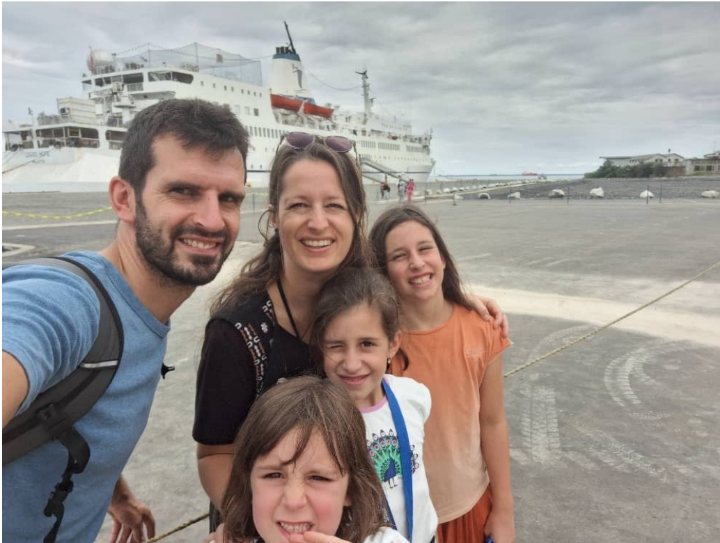
Op bezoek bij: de Logos Hope - een enorme bibliotheek