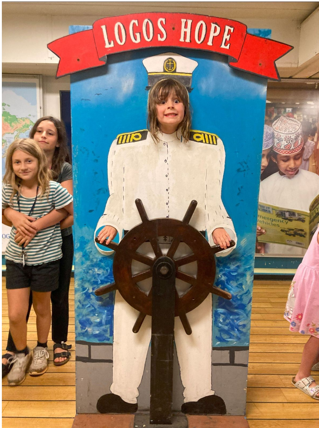
Naast boeken ook wat ander vermaak