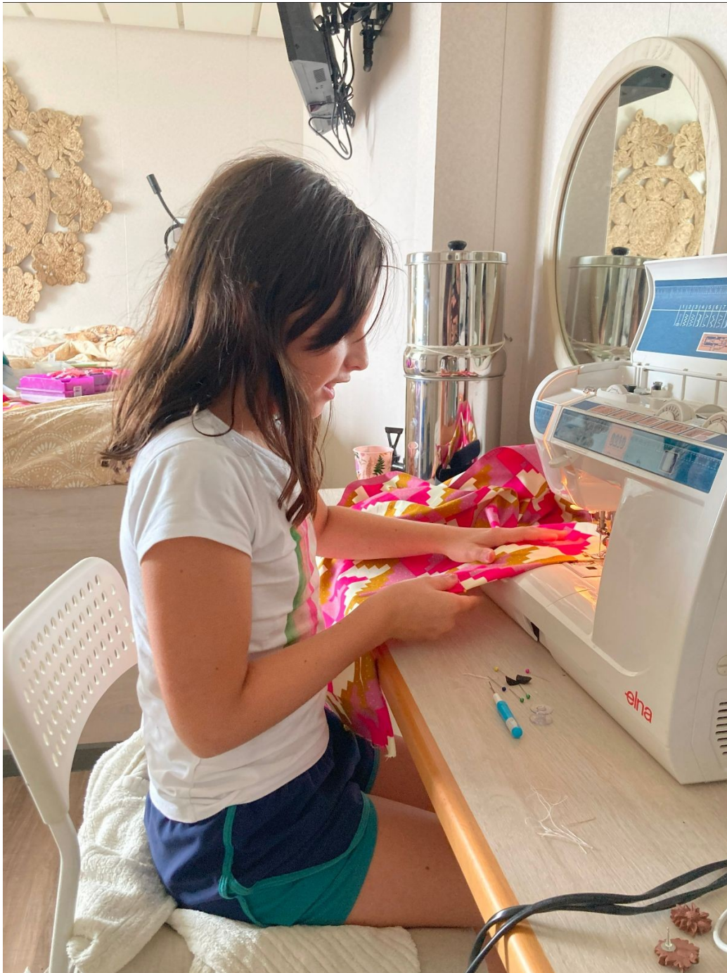
Zelf achter de naaimachine

Voor het laatste nieuws over ons zie www.jobsee.nl > blog