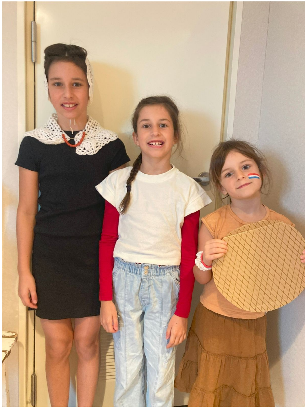
Jabulani dag: verkleed jezelf met iets vanuit het land waar je vandaan komt